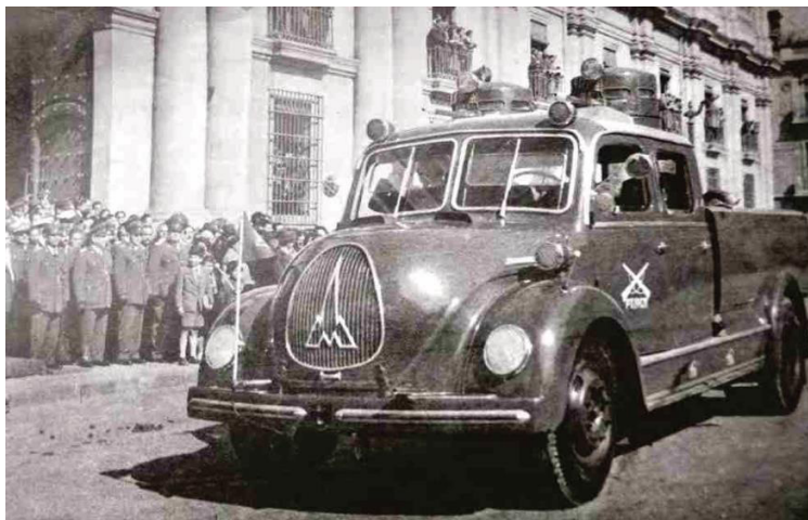
Imagen 1. Vista del primer modelo de carro lanza agua 7