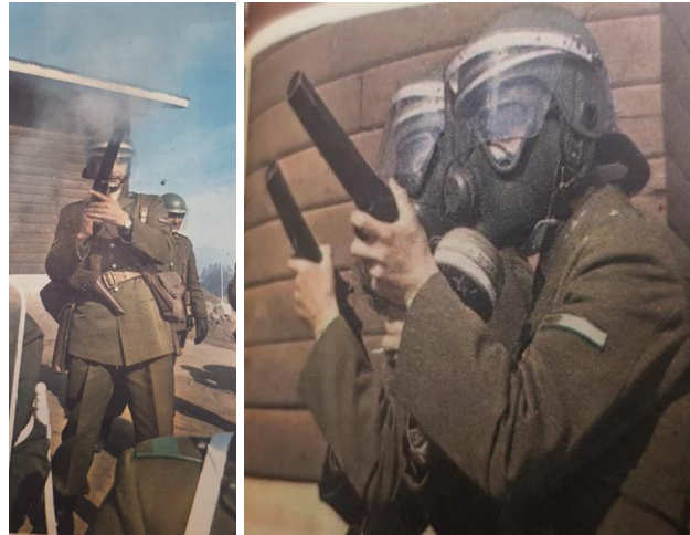
Imagen 4. Equipamiento y armamento antidisturbios del Grupo Móvil durante la década de 1960